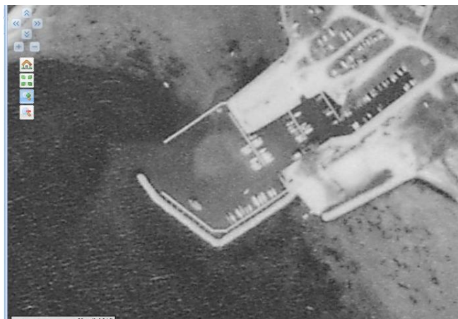
Luffotos 1977 og 1981-83 i h.t. www.grundkortfyn.dk

For at imødekomme klubbens motorbådssejlere overvejede bestyrelsen at fremsætte et forslag til navneforandring til Faldsled Sejl- og Motorbådsklub. Dette navn blev vedtaget på generalforsamlingen i 1983.