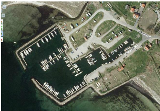
Lufffoto 2012

2008-10 blev havnen udvidet mod nord med 25 nye pladser og ny læmole. FSM var kun perifert involveret heri ved fremskaffelse af konsulentbistand til vurdering af evt. tilsanding